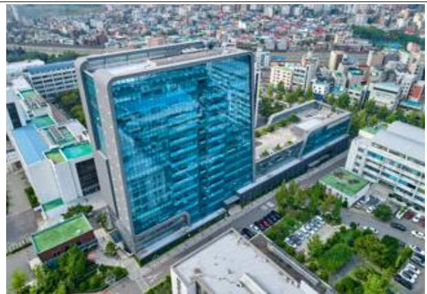
○ 60주년 기념관