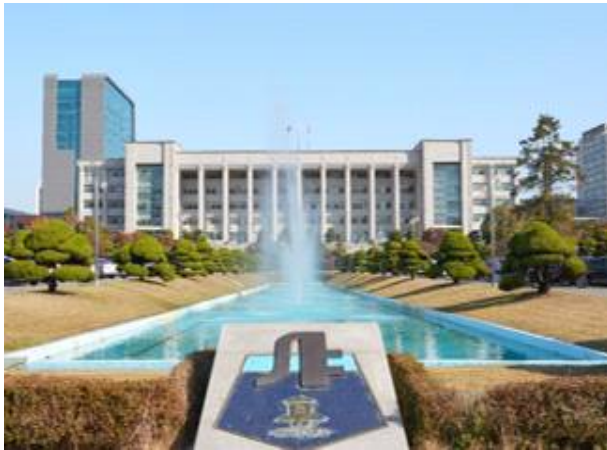
○ The main building of Inha University