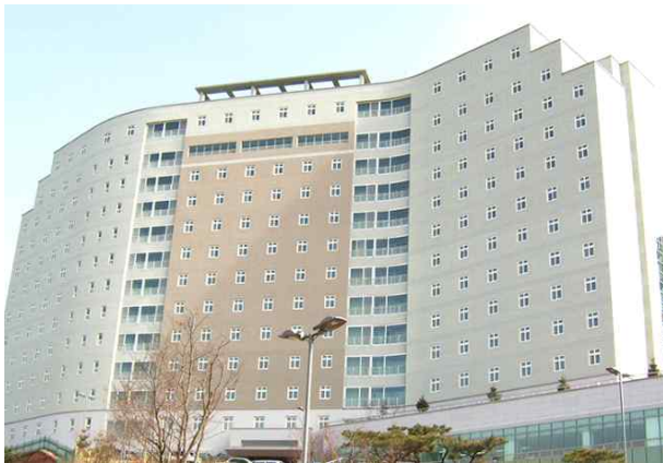
○ Dormitory(2nd Dormitory)