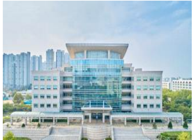
○ Jungseok Memorial Library