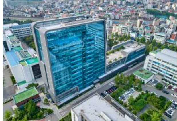
○ 60 th Anniversary Hall